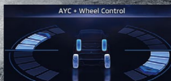
HỆ THỐNG KIỂM SOÁT VÀO CUA CHỦ ĐỘNG - AYC